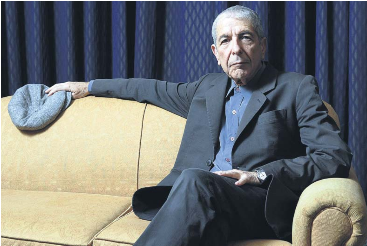
El cantautor canadiense Leonard Cohen murió en 2016 a los 82 años.