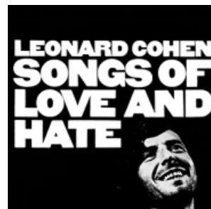
El disco Songs of love and hate se publicó el 19 de marzo de 1971. COLUMBIA RECORDS

Las canciones de Songs of love and hate no son originales ni compuestas para el álbum. Por eso sorprende que dialoguen entre ellas de una forma enfermiza, por la rareza que supone saber que el hastío vital de Cohen y su mortificación le venían persiguiendo desde hacía años a través de una herencia judía que le recordaba a un padre muerto, las drogas, nombres de mujeres que se solapaban en