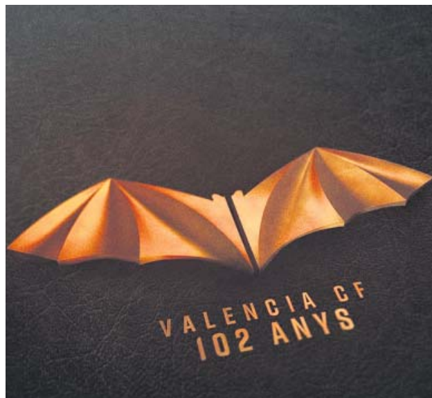
Logo del 102 aniversario del club che.

Los rumores sobre una posible venta del club vivieron ayer un episodio más y lo hicieron a través de las redes sociales, con el príncipe de Johor como protagonista. Tunku Ismail reconoció, a través de diversas publicaciones en su cuenta oficial de Instagram, que ha estado negociando estos días con Peter Lim para la adquisición del club -o, al menos, para entrar