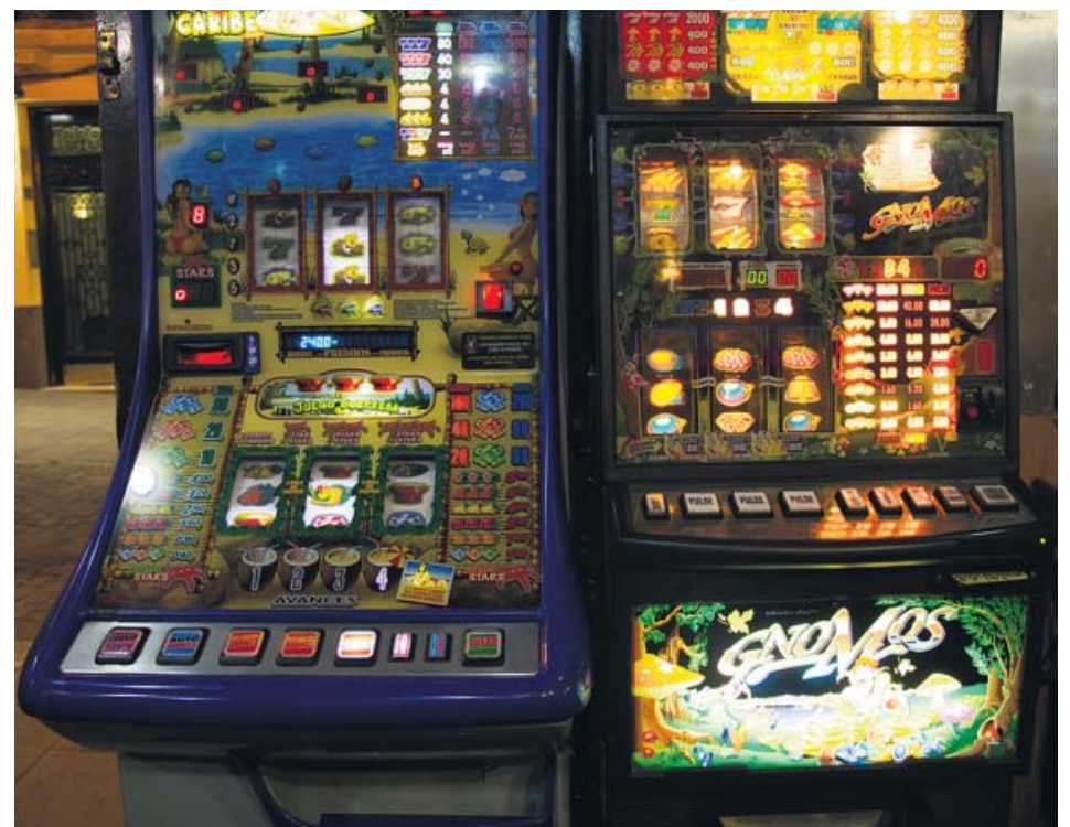
Imagen de archivo de dos máquinas tragaperras, que se pueden volver a usar en bares.