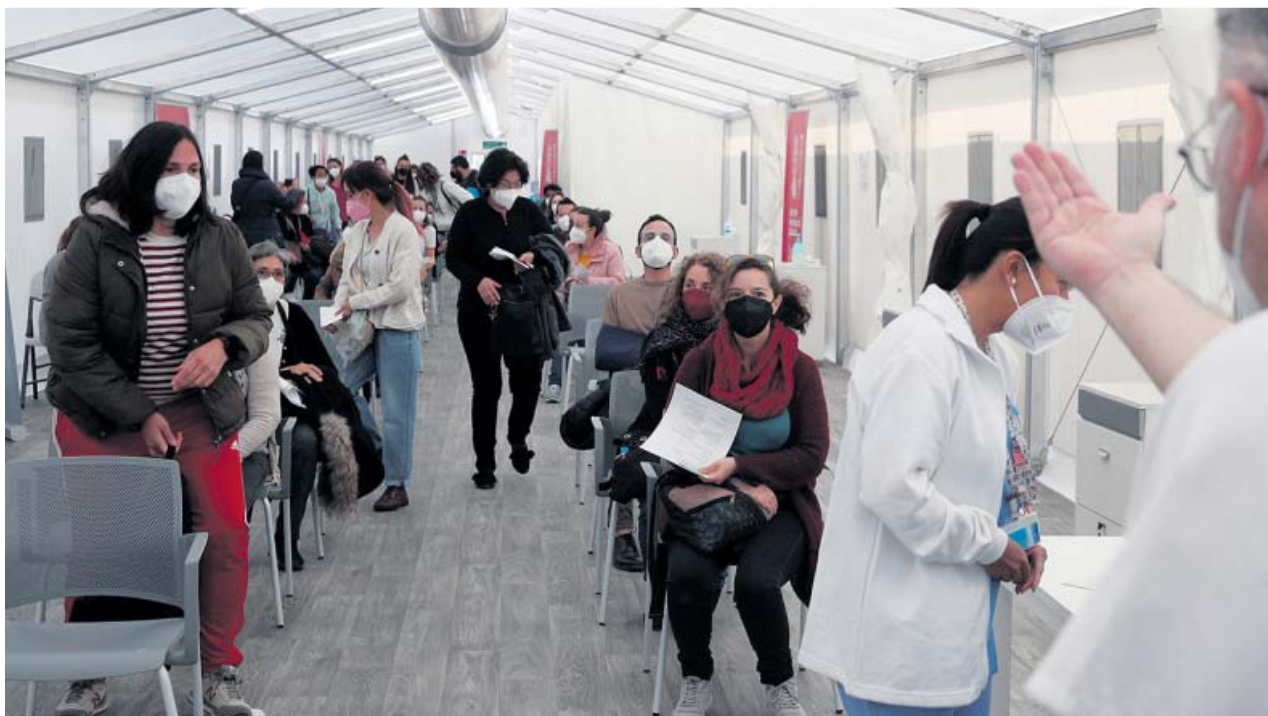
Personal educativo de la Comunidad Valenciana, listo para ser vacunado a principios de esta semana.

En torno a 20 millones de personas han recibido la vacuna de AstraZeneca en la UE y en el Reino Unido, donde no se han suspendido las vacunaciones. La EMA ha revisado solo siete casos de trombos en múltiples vasos sanguíneos y 18 de trombos en las venas que envían sangre al cerebro, los más preocupantes para el regulador sanitario. Las principales dudas se mantienen entre los pacientes más jóvenes y, particularmente, entre las mujeres. ●