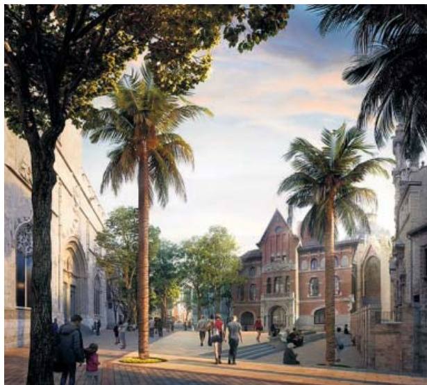
Figuración virtual de la reforma de la plaza del Mercat.