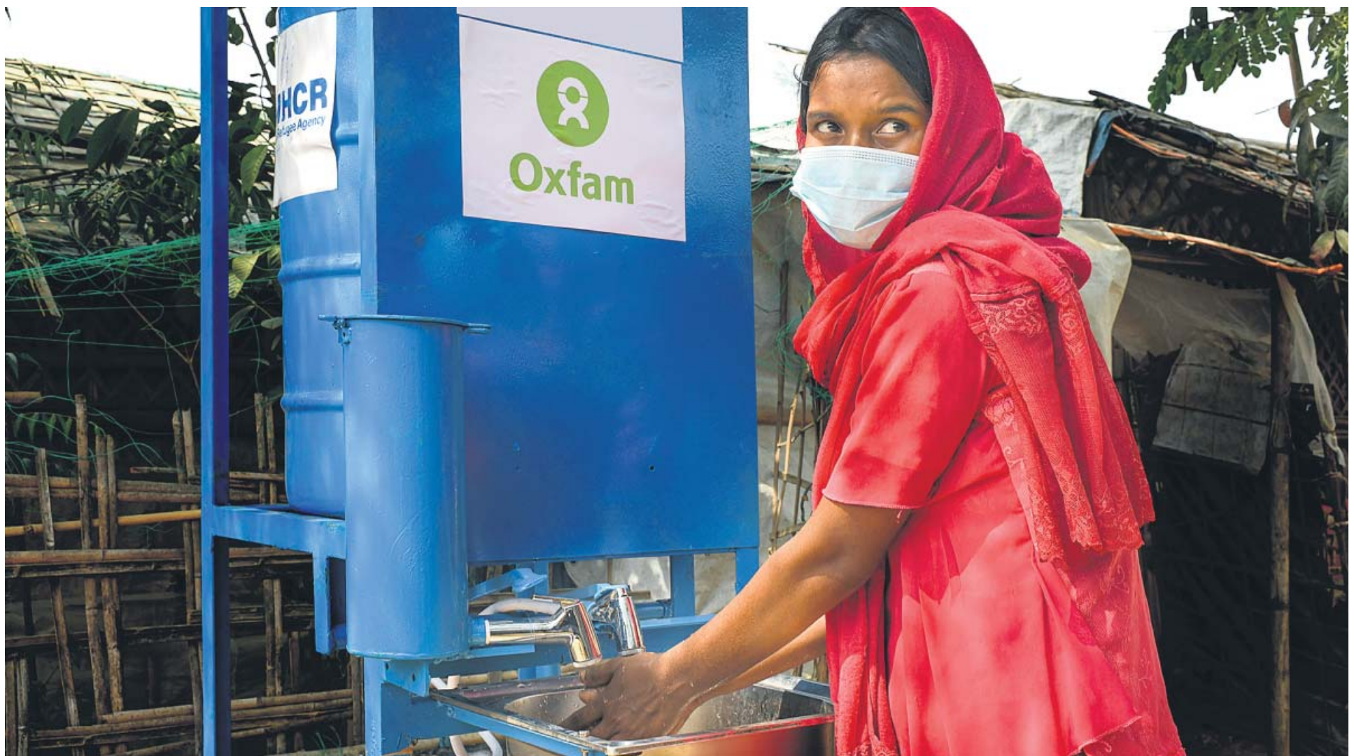
Una de las instalaciones de lavado de manos sin contacto que Oxfam Intermón ha colocado en el campo rohingya de Cox's Bazaar, en Bangladesh, donde viven más de 850.000 personas refugiadas.