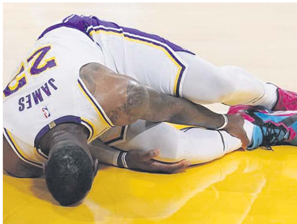
LeBron James, tras su lesión en el tobillo derecho ante los Atlanta Hawks.

El esguince de tobillo que sufrió en el partido ante los Atlanta Hawks tendrá a LeBron James de baja un tiempo indefinido, según confirmó ayer su equipo, Los Angeles Lakers. La megaestrella de la NBA chocó de manera fortuita con Solomon Hill, quien le torció el tobillo derecho cuando pugnaban por un balón suelto. LeBron, que derribó una silla por la frustración cuando se dirigía al vestuario, tratará de estar listo para el inicio de los playoffs, pero el tiempo que estará sin jugar es una incógnita. ● R. D.