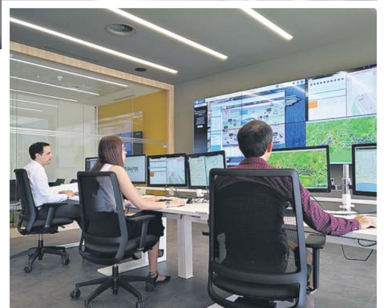
La innovación es una pieza clave de cara a enfrentar los retos en la gestión del agua.

Los grandes retos a los que se enfrenta la sociedad actual, como la lucha contra la emergencia climática o la actual crisis sanitaria, son más fáciles de superar con el apoyo de la tecnología y las herramientas digitales. La gestión e interpretación de datos ( big data ), las me-