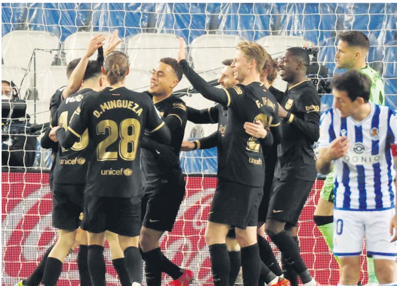
Los jugadores del FC Barcelona celebran uno de los goles ante la Real Sociedad.