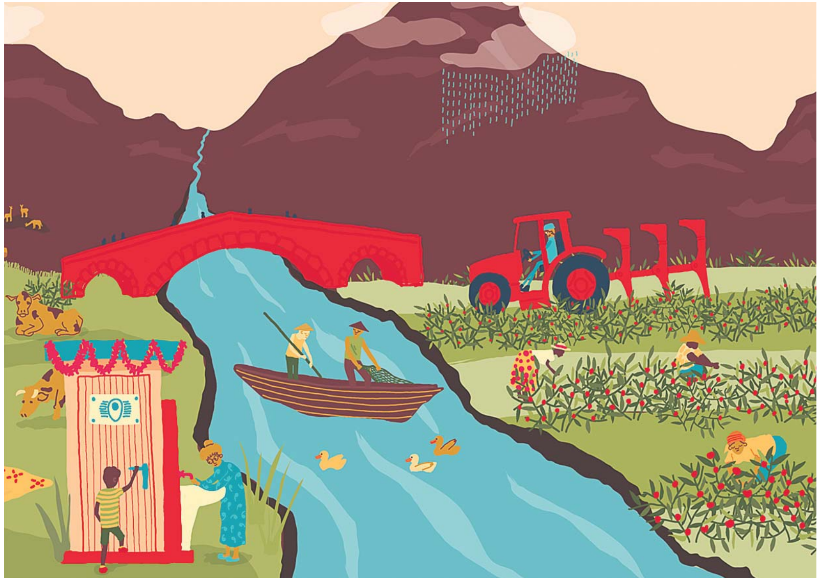
El lema de este año, Valoremos el agua , plantea una reflexión en torno a los distintos usos y concepciones de un bien muy preciado.

Este día sirve para concienciar, además, de las desigualdades presentes en la actualidad, así como para propiciar la adopción de medidas para afrontar la crisis mundial del agua. De hecho, uno de los objetivos principales actualmente es respaldar la consecución del Objetivo de Desarrollo Sostenible (ODS) número 6: agua y saneamiento para todos de cara al año 2030 [ver página 4].