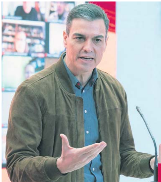
Pedro Sánchez, en una imagen de archivo.

«El reto es que seamos capaces de hacer bien el reparto de fon-