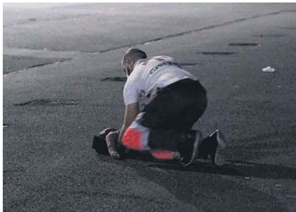
Nabody consiguió ser reanimada en el muelle de Arguineguín, pero falleció ayer.

Asimismo, pactaron cambios en la gestión del orden público que pasan por «suspender el uso de los proyectiles de foam por parte de los cuerpos policiales en Cataluña». El pacto fue alcanzado al margen de Junts, la formación de Carles Puigdemont. ●