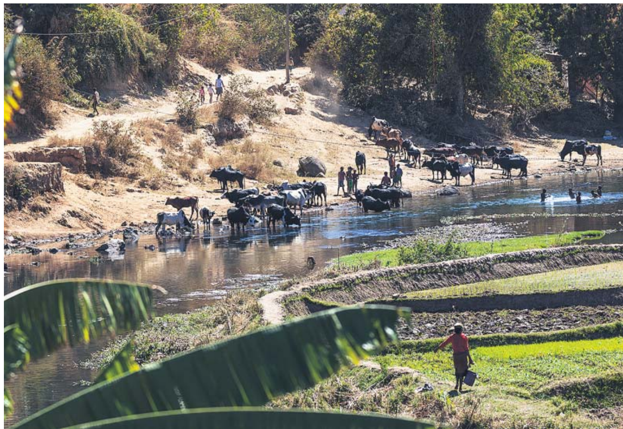
El acceso al agua es complicado en algunas zonas del planeta como Ampefy, en el centro de Madagascar (África).

El agua, el elixir de la vida, es un recurso necesario y, en muchas regiones, un lujo. Tres de cada diez personas carecen de acceso a servicios de agua potable y, cada día, alrededor de mil niños mueren a causa de enfermedades diarreicas asociadas a la falta de higiene