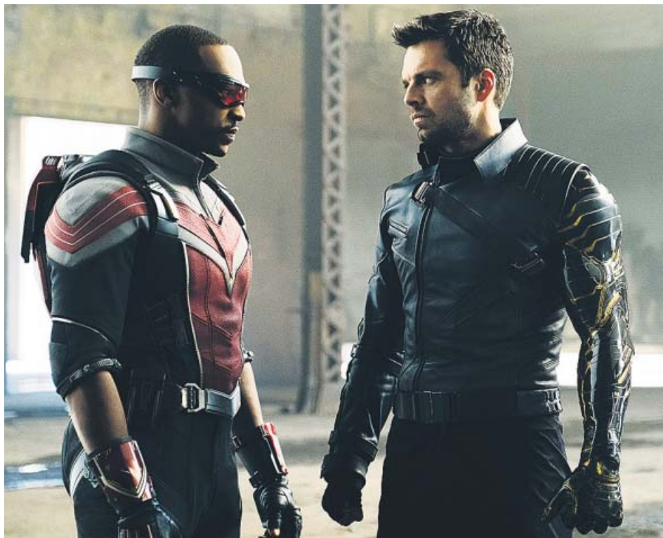
Los personajes protagonistas de la serie, Sam Wilson y Bucky Barnes.

«El legado del Capitán América no es tan limpio como debería, sobre todo para un afroamericano», explica Mackie sobre las reticencias iniciales que tu-