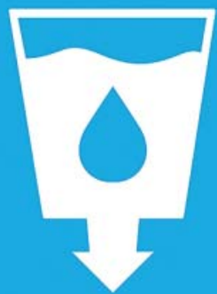
Icono del sexto de los ODS de la Agenda 2030. ONU