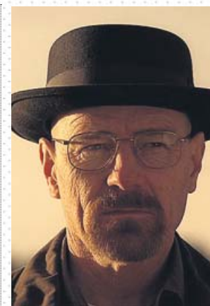
El actor Bryan Cranston, protagonista de la serie.

Está claro que ver a Walter cada vez más empecinado