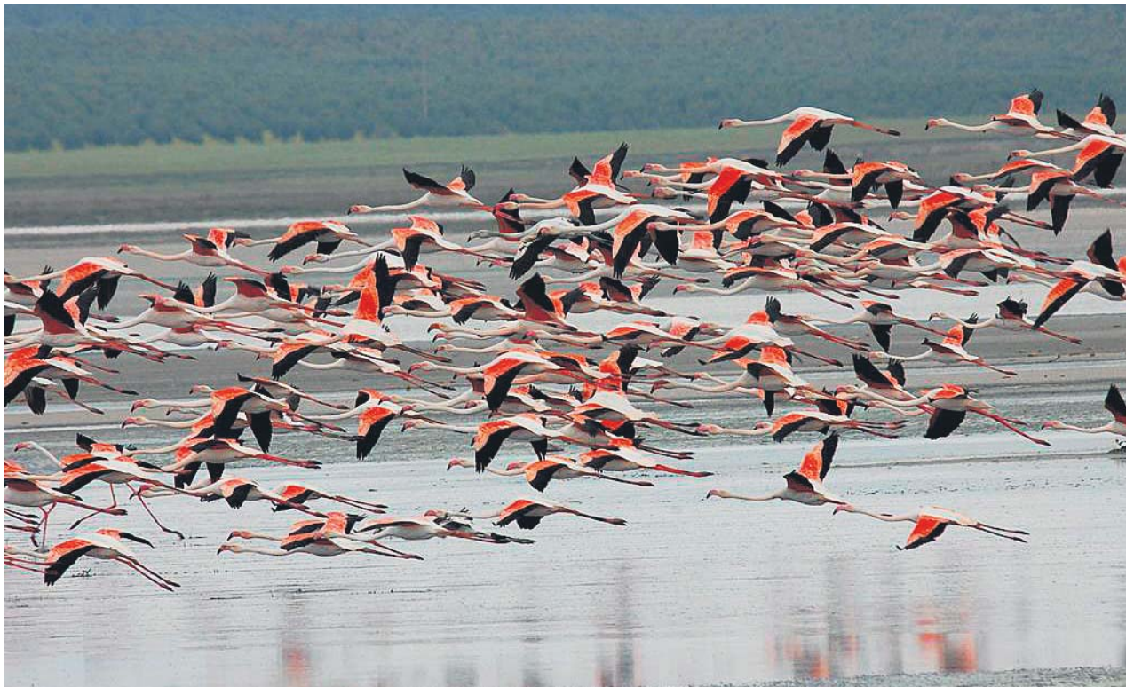
Bandada de flamencos en Fuente de Piedra, Málaga, una de las colonias más importantes de Europa.