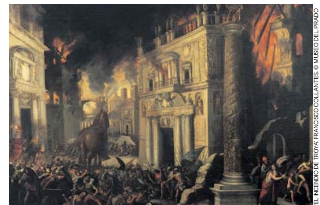
EL INCENDIO DE TROYA. FRANCISCO COLLANTES.