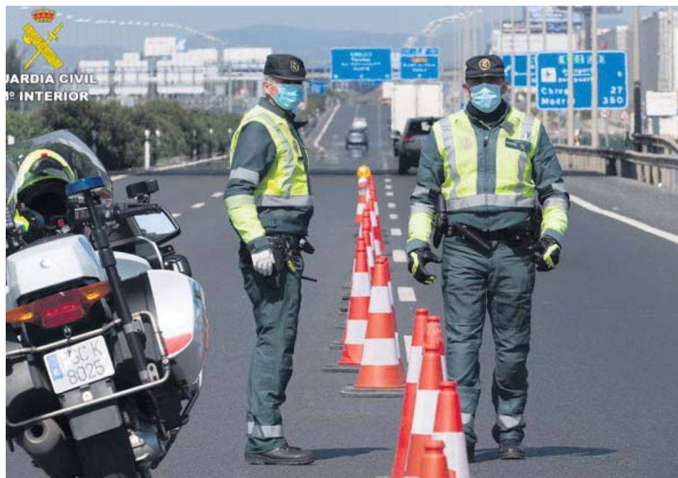
Un operativo de vigilancia de tráfico en la provincia de Valencia.