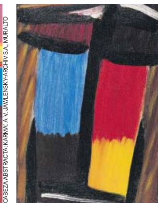
GRAN MEDITACIÓN. MUSEUM SZUKI

do, un enamorado», escribió el pintor. Es en el retrato donde Jawlensky desarrolla particularmente esa visión: reduciendo los rostros a las