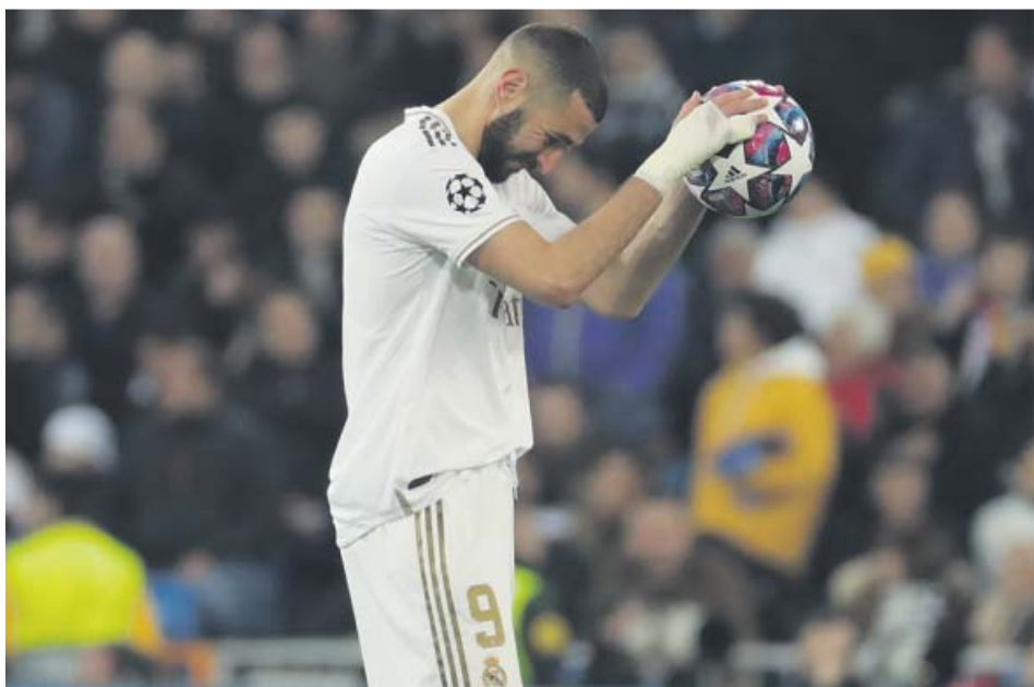
Karim Benzema en un partido de esta temporada con el Real Madrid.