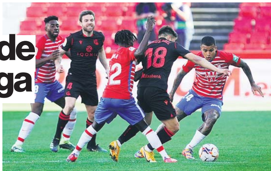
Los 42 clubes de LaLiga Santander y LaLiga SmartBank tienen a su disposición Mediacoach.

Hace poco más de diez años, LaLiga creó Mediacoach, un complejo sistema mediante el que se recoge todo lo que ocurre en cada partido en forma de datos, informes y clips de vídeo. Los analistas son la figura que se encarga de traducir toda esa información dentro de los clubes para mejorar la competitividad y el rendimiento