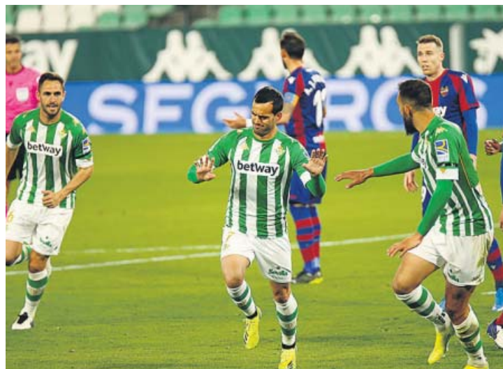
La temporada pasada se generaron más de un millón y medio de clips de vídeo. LALIGA

Ahora que la figura del analista ya está muy asentada, el del Granada CF cree que para dedicarse a este trabajo «lo fundamental es ese conocimiento del juego y de las herramientas tecnológicas. Pero, ¿es lo más importante? Creo que no, al final los valores humanos están muy vinculados a tu éxito profesional».