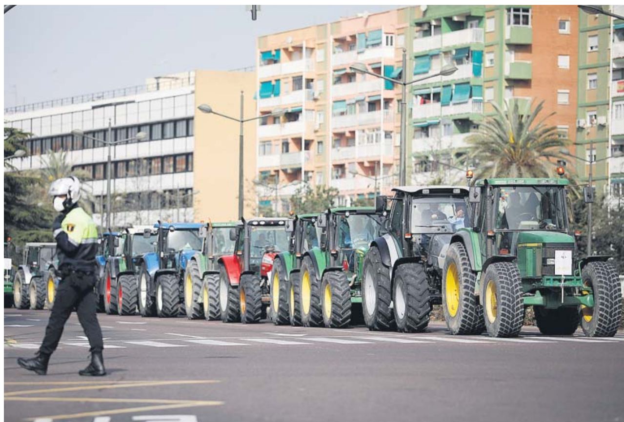
La tractorada desfiló ayer por València en protesta por la propuesta del ministerio de cara a la futura PAC.

«Peligra el futuro del sector arrocero valenciano. Los planes de Madrid amenazan con recortar hasta un 50% las ayudas de la PAC al arroz, lo que haría inviable e insostenible el cultivo», explicó Aguado, que defendió que, «sin arroz», parques naturales como la Albufera y el Marjal Pego-Oliva «serían un cañar lleno de mosquitos». De prosperar la propuesta del ministerio, estas asociaciones vaticinan unas pérdidas de unos 7 millones de euros anuales para los arroceros valencianos, lo que en total sumaría más de 35 millones de euros durante esos cinco años.