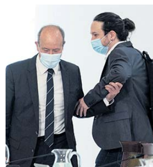
Pablo Iglesias y Juan Carlos Campo, titular de Justicia.

Iglesias, que será el candidato de Unidas Podemos a la presidencia de la Comunidad de Madrid, se muestra orgulloso de haber logrado en un