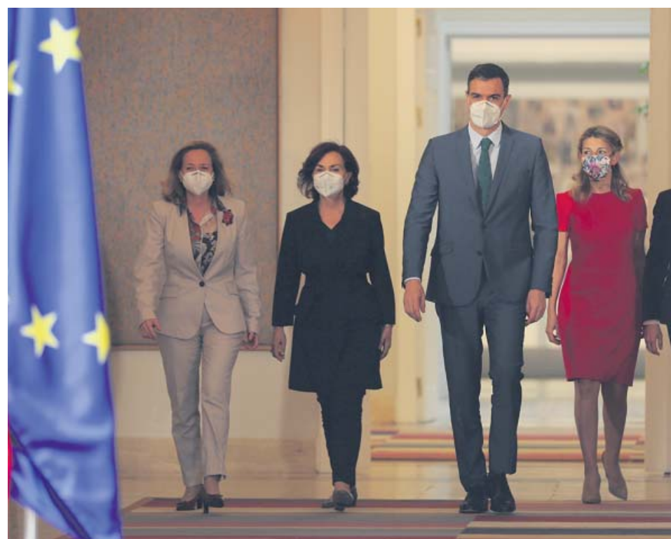
Pedro Sánchez, acompañado de sus vicepresidentas.

La hasta ahora secretaria de Estado para la Agenda 2030 se convierte en ministra y dirigirá el departamento que hasta ahora lideraba Iglesias, pero ya sin rango de Vicepresidencia.