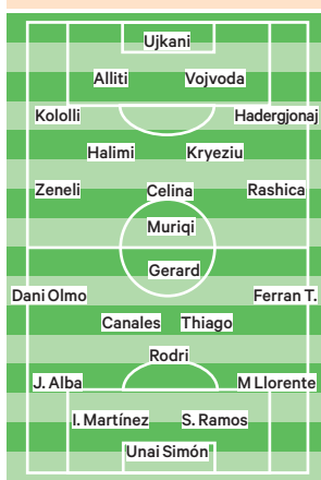
La Cartuja (Sevilla) Hoy, 20.45 horas | Clasif. Mundial

mente con hasta diez jugadores por detrás del balón durante muchas fases del juego y una desgraciada jugada costó dos puntos con el empate a uno final. En Georgia, la imagen fue aún peor, con una nefasta primera parte en la que España se fue por detrás en el marcador, sin tener en ningún momento el control del juego.