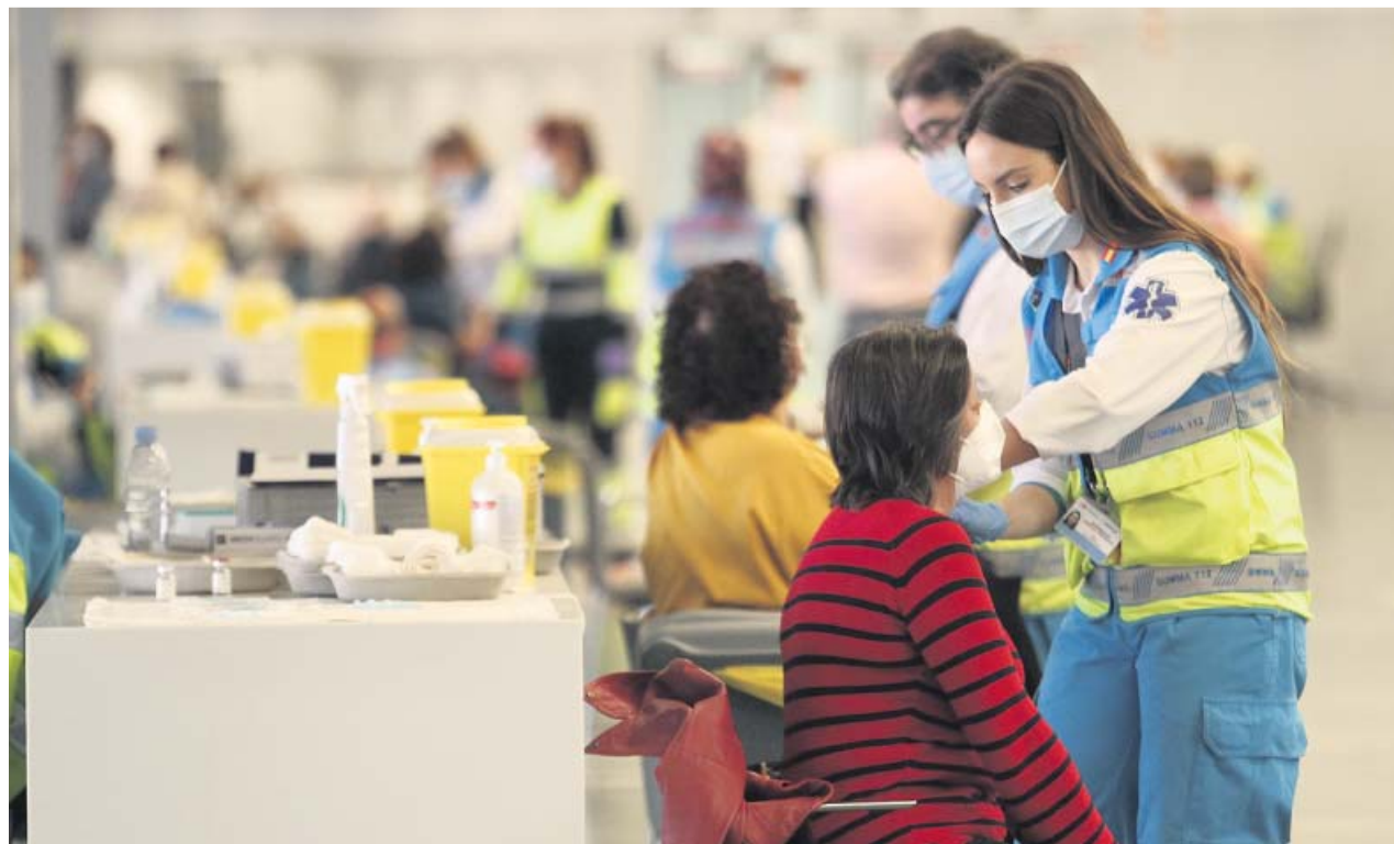
Personal sanitario vacunando a personas de 60 a 65 años, ayer en el Wanda Metropolitano de Madrid. JORGE PARÍS