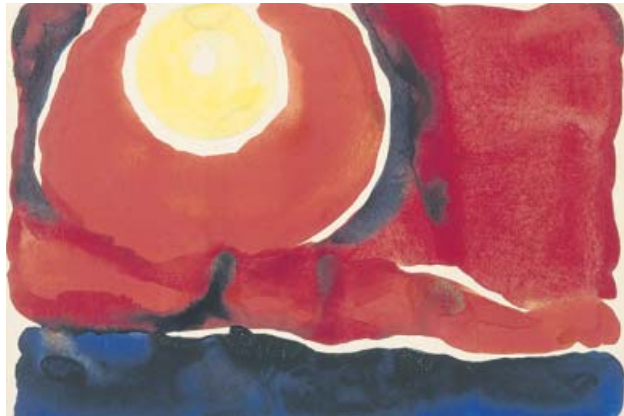
TUCERO DE LA TARDE N.º VI. © GEORGIA O'KEEFFE MUSEUM

Es una de las artistas americanas más representativas del siglo XX y su obra podrá disfrutarse por primera vez en nuestro país a través de una selección de 80 pinturas de toda su trayectoria pictórica. Pionera del arte figurativo abstracto, la obra de O'Keeffe (1887-1986) es reconocida por sus flores, sus famosas vistas de Nueva York o los paisajes de Nuevo México. A menudo se ha interpretado gran parte de su pintura, especialmente la floral, como la representación sim-