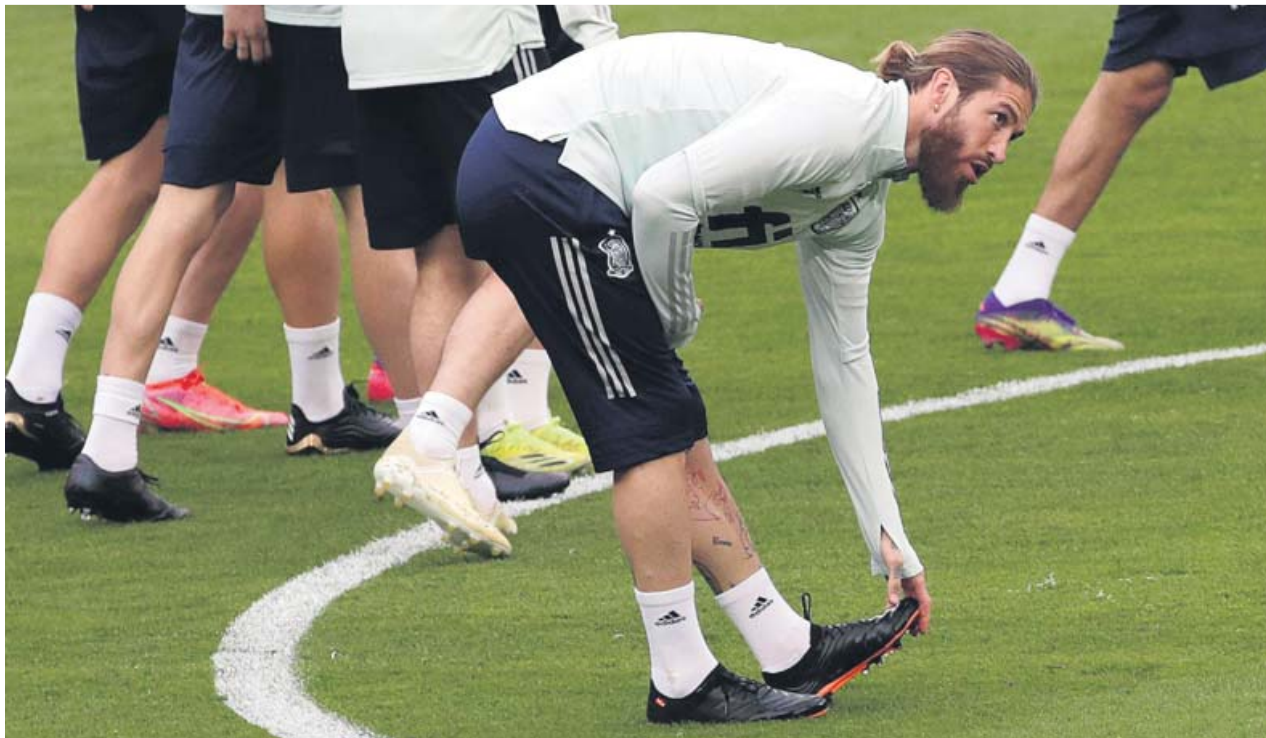
Sergio Ramos cumplió ayer 35 años. El sevillano, recuperado de sus molestias, apunta al once ante Kosovo.

España se mide hoy a Kosovo en el tercer partido de la clasificación mundialista. El objetivo es vencer... y también convencer