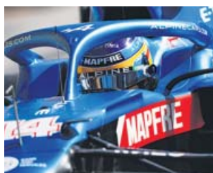
Alonso, conduciendo el Alpine en Baréin.

Apenas unos días después del comienzo del Mundial de Fórmula 1, una de las voces más autorizadas sobre el circo del motor dio su opinión. Fue el propio director del Mundial, Ross Brawn que, entre otras cosas, habló del regreso de Fernando Alonso: «En Baréin pudimos ver al antiguo Fernando Alonso, que demostró