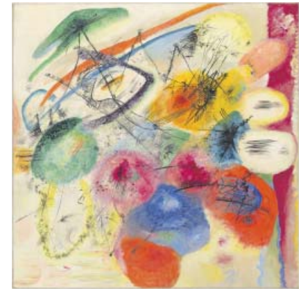
LÍNEAS NEGRAS. © VASILY KANDINSKY, VEGAP, BILBAO 2020

En Sobre lo espiritual en el arte , Vasily Kandinsky (1866-1944), pionero de la abstracción, se refería a la «necesidad interior» del artista como fuente temática. Experimentar con los recursos propios de su personalidad lo llevó a desligar la pintura de las normas del mundo natural. Su transgresión de los límites expresivos del color y la composición fueron el origen de un lenguaje artístico en el que se reflejaban los rasgos utópicos de la vanguardia rusa. Las formas geométricas,