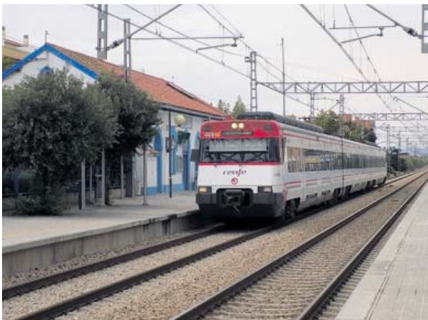
Un tren de Cercanías del núcleo de València.