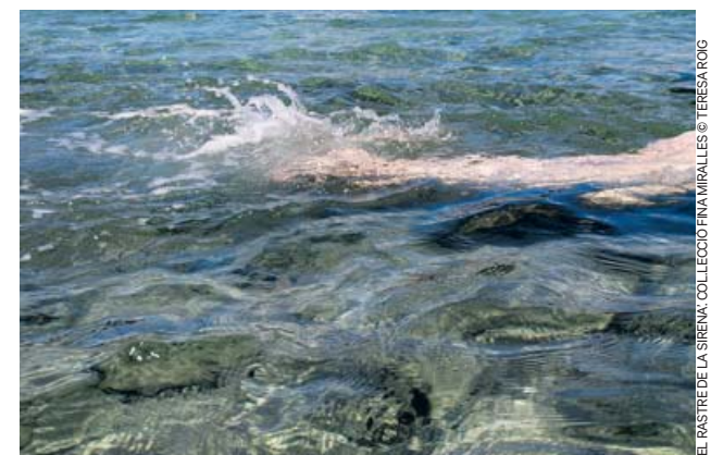
EL RASTRE DE LA SIRENA. COLLECCIÓN FINA MIRALLES. © TERESA ROIG

La obra de Fina Miralles (Sabadell, 1950) rompe desde sus inicios los límites de lo artístico. Reconocida por la crítica como artista conceptual, la condición de las mujeres —especialmente sujetas a la autoridad masculina y en condición de inferioridad social durante la dictadura franquista— tiene particular relevancia en la temática de su producción. También sus reflexiones sobre la relación humana con la naturaleza a través del land art o los bode-