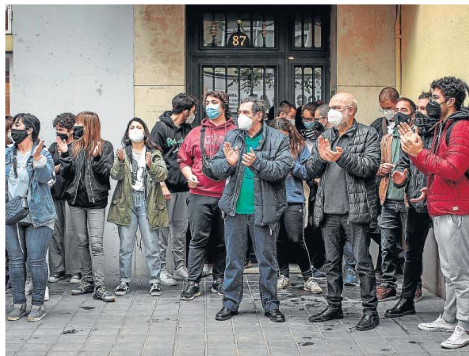
Activistas en la concentración que ayer logró paralizar el desahucio.

Un grupo de activistas de distintos colectivos, como la Plataforma de Afectados por la Hipoteca (PAH) València, Entrebarris y Stop Desahucios, paralizó ayer el desalojo de una mujer de más de 70 años que vive de alquiler en la calle Guillem de Castro, mientras sus representantes legales negociaron con la comisión judicial el atraso de la acción. Estos colectivos consideran que la mujer entra en el supuesto del decreto antideshucios, pero «no le reconocen los requisitos». ●