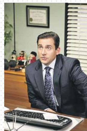
Steve Carell interpreta a Michael Scott.

El recurso a la empatía del espectador funcionó: The Office (US) aguantó nueve temporadas en antena (las