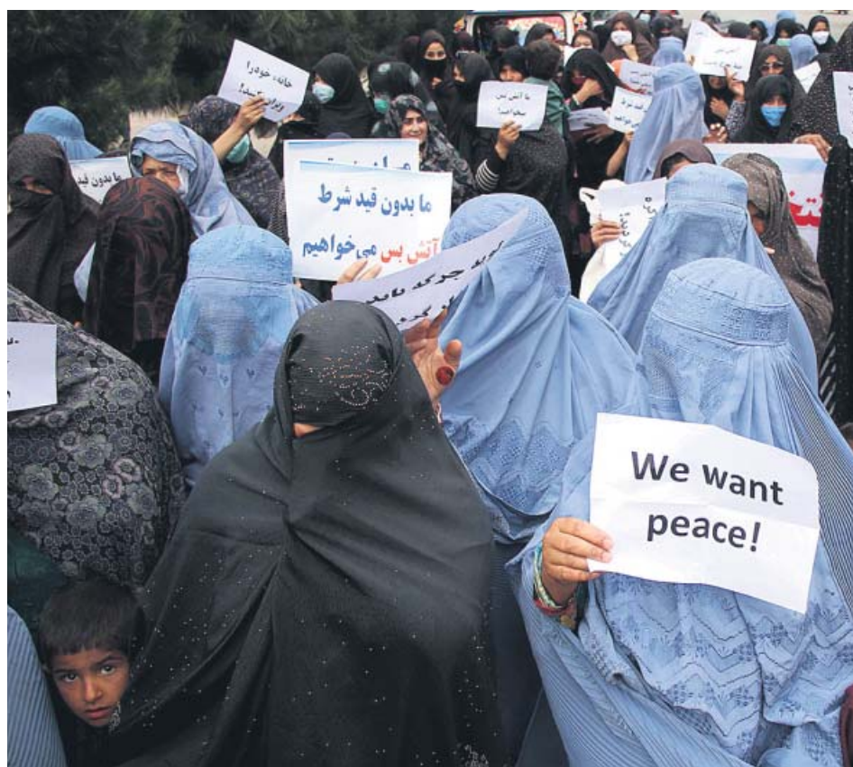
Muchas mujeres reclamaron ayer paz durante las protestas en Herat (Afganistán).

Cientos de afganos salieron ayer a la calle en Herat para condenar la violencia y suplicar por la paz. Las marchas por la paz llegan durante la última fase de retirada de las tropas de Estados Unidos de la zona, lo que alienta el miedo al regreso de los talibanes. Precisamente este fin de semana se difundieron varios vídeos en los que una mujer afgana recibía 40 latigazos delante de una multitud que asistía al drama. El castigo había sido impuesto por un tribunal talibán en Herat y la mujer había sido acusada de «relaciones inmorales» por hablar por teléfono con un hombre. ●