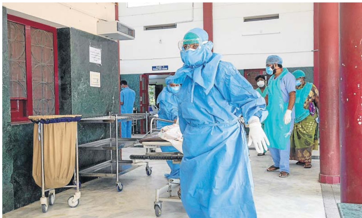
Sanitarios atienden a pacientes Covid en el hospital que la Fundación Vicente Ferrer tiene en la localidad india de Bathalapalli.

«Nuestro proveedor se encuentra en otro Estado y ahora los Estados están intentando