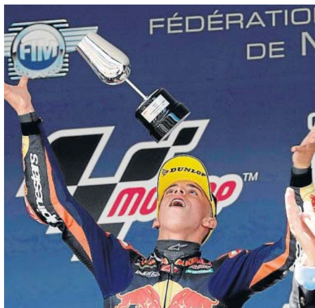
Pedro Acosta celebra su triunfo en el GP de España de Moto3.

«Toca adelantar un piloto por curva... ¡y ya está!», avisó el de Mazarrón en la clasificación, después de confirmar que saldría decimotercero en el Circuito de Jerez-Ángel Nieto. Dicho y hecho. Con desgarro, confianza y, sobre todo, un extraordinario pilotaje, el joven piloto de 16 años volvió a sorprender.