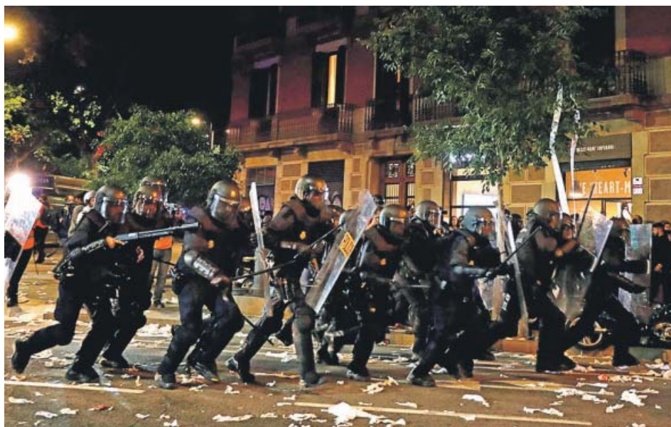
Policías cargando contra una protesta convocada por los CDR en Barcelona, en octubre de 2019.

En un primer momento, cuenta a 20minutos , le abrieron una información reservada, el paso previo al expediente disciplinario: «Citaron a declarar a varios compañeros y yo presenté fotos de otros sindicatos que ya circulaban». Esto le valió que finalmente la propuesta de sanción en una primera instancia