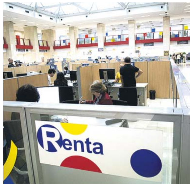
Oficinas de la Agencia Tributaria en Madrid.

Ante las informaciones de este plan del Gobierno de eliminar la tributación conjunta del IRPF, las críticas no se hicieron esperar por parte de toda la oposición. Por un lado, la portavoz del PP en el Congreso, Cuca Gamarra, dijo que así «Sánchez asfixia otra vez a clases medias y familias». Por otro, el líder de Más País, Iñigo Errejón, calificó esta medida de «un error en el peor momento» porque «si hay que recaudar no puede ser cargando un peso más sobre los hombros de quien menos tiene». Y la presidenta de Cs, Inés Arrimadas, también criticó que Sánchez celebrara el Día de la Madre «sableando a impuestos a cuatro millones de familias».