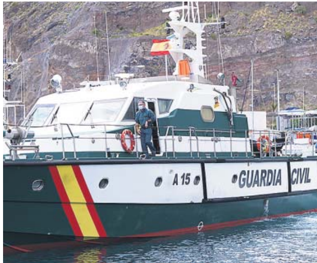
Operativo de búsqueda desplegado en Tenerife.