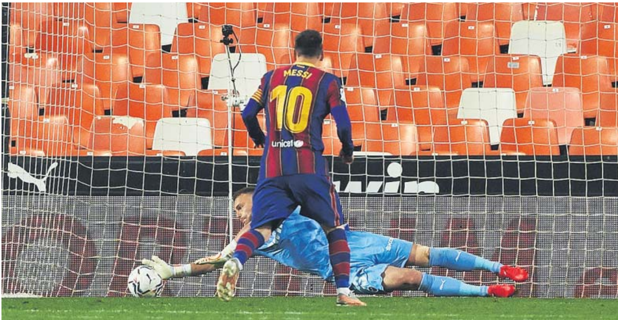
Cillessen le detiene el penalti a Messi antes de que el argentino marcara justo después.