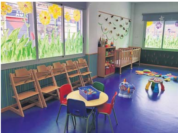
Imagen de un aula de Educación Infantil. AJUNTAMENT DE VALÈNCIA