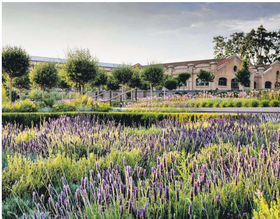
El Parque Central es una de las grandes zonas verdes en pleno corazón de la ciudad.

CIUDADANÍA. El proyecto beneficiará por una parte a las personas, hogares y entidades más motivadas en impulsar la transición energética y, por otra, a los sectores más necesitados que sufren pobreza energética.