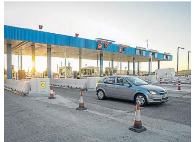
Peaje en el día previo al fin de la concesión de la AP-4.

En su opinión, imponer un peaje en las vías de alta capacidad no va a obligar al conductor a desviarse a las carreteras convencionales, que ya nadie utiliza para viajes largos. ●