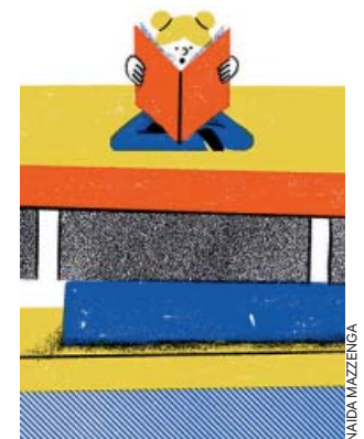
Chiki Fabregat y Beatriz Osés, premios SM juvenil e infantil