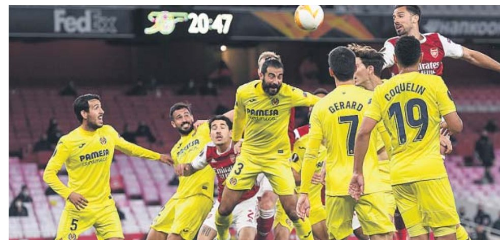
EL VILLARREAL SE CITA CON EL UNITED EN LA FINAL DE LA LIGA EUROPA