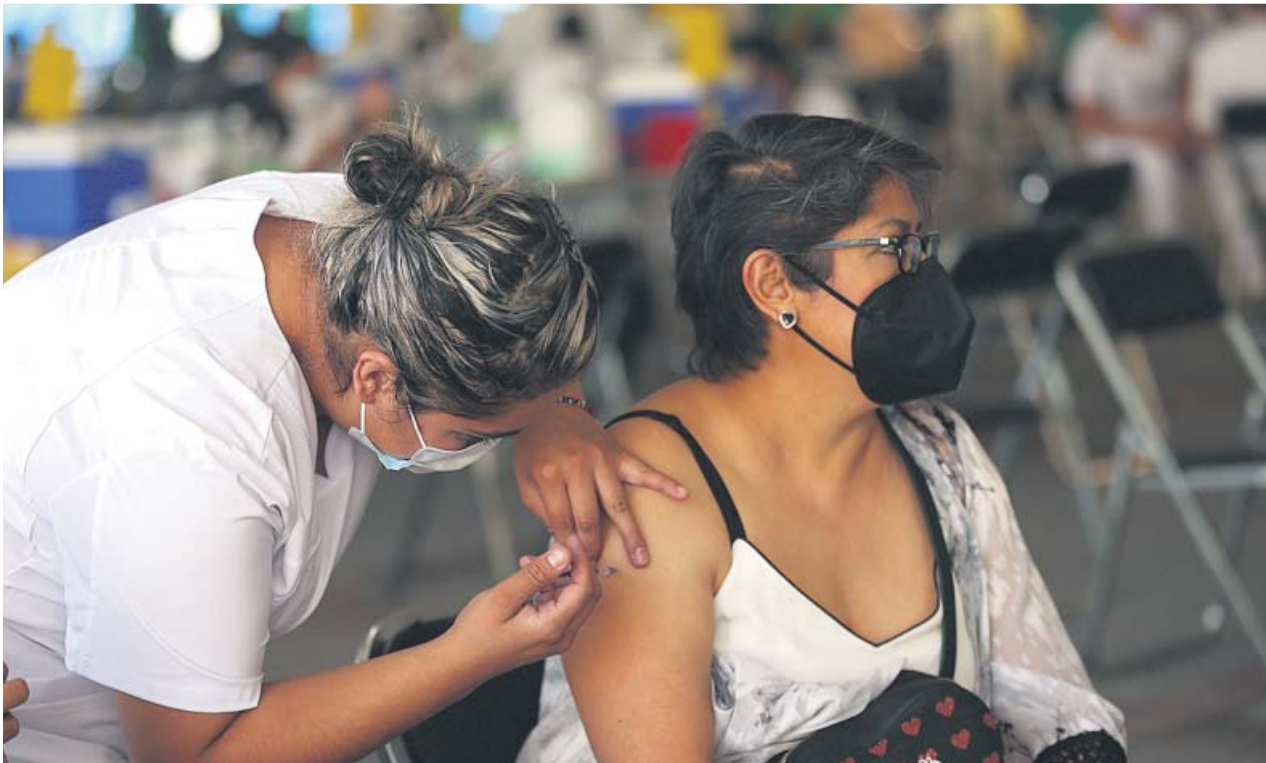
Una sanitaria inyecta una dosis de la vacuna contra la Covid a una mujer en Ciudad de México.