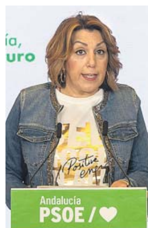
Susana Díaz, ayer, en rueda de prensa.

socialistas consideran que los comicios estaban claramente «circunscritos» al ámbito madrileño, que tiene una «estructura singular», e insisten en que el batacazo de la candidatura liderada por Gabilondo «no va a condicionar la política del Gobierno de España». Si creen los socialistas, en cambio, que se ha certificado la «liquidación del proyecto político» de Ciudadanos, «propiciado» por la estrategia del PP de «engullir» a la formación de Inés Arrimadas. ●