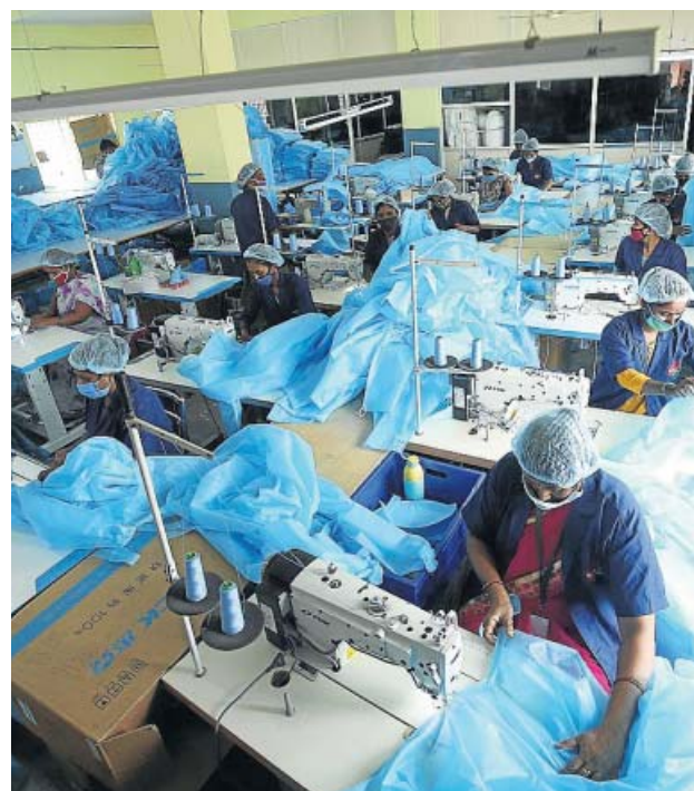
Obremos indios trabajan en la fabricación de EPI.

El país asiático, el segundo país más poblado del mundo (con más de 1.352.000.000 habitantes), también es el segundo más afectado del planeta por la pandemia en términos absolutos, con 32,5 millones de casos según la Universidad Johns Hopkins, solo por detrás de Estados Unidos. Precisamente a este país se dirigió ayer para elogiar su nueva postura respecto a terminar con las patentes de las vacunas contra el coronavirus, que permitirían a los países pobres fabricarlas también: «Celebra-