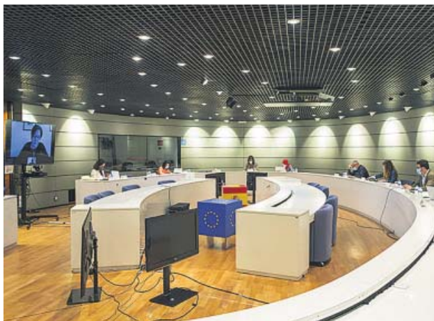
Reunión de la Comisión que estudia la prórroga de los ERTE. EP

La prórroga sería con una fórmula similar a la actual, según planteó ayer el Gobierno a patronal y sindicatos