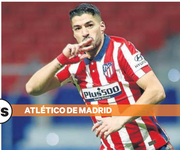
ATLÉTICO DE MADRID