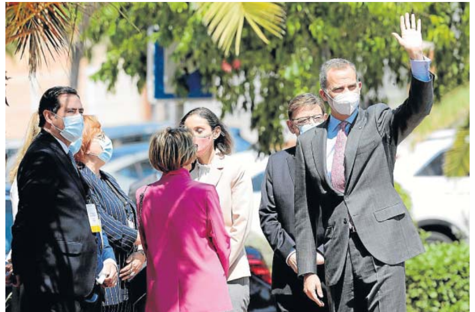
Felipe VI saluda a su llegada a la Asamblea General de la CEV.

La presidenta del PPCV insistió en que le habría gustado presentarse a la reelección, como siempre sostuvo mientras creía que tenía la confianza de la dirección nacional del partido, hasta que se le dijo «que no, que había un mejor candidato», en alusión, sin citarlo, al presidente del PP de Alicante, Carlos Mazón. Además, dijo que una encuesta apuntaba a la posibilidad de un «vuelco electoral» en la Comunitat Valenciana, por lo que le habría gustado tener una segunda oportunidad. ●