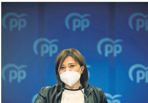
Bonig, ayer, en su comparecencia.

Por otro lado, la Policía Nacional detuvo en las inmediaciones del campus a dos personas que participaban en una concentración de protesta con motivo de la visita del monarca. ●