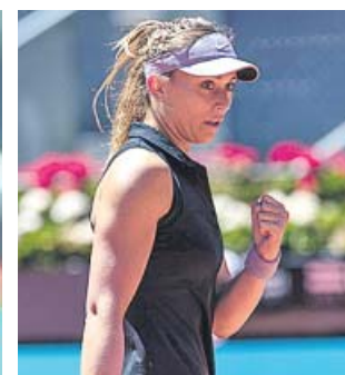
Nadal y Badosa, durante los partidos de ayer.