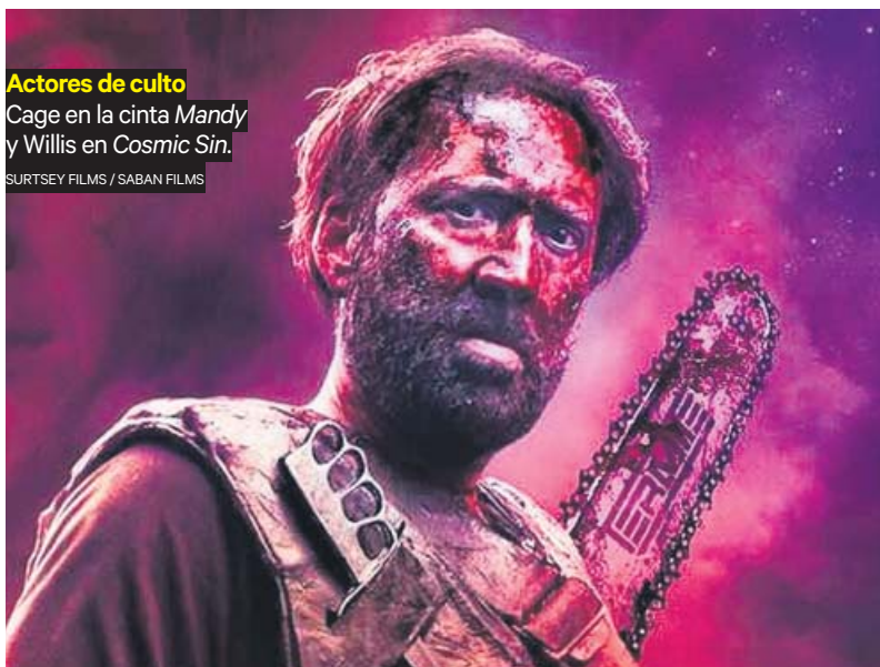
Actores de culto Cage en la cinta Mandy y Willis en Cosmic Sin .