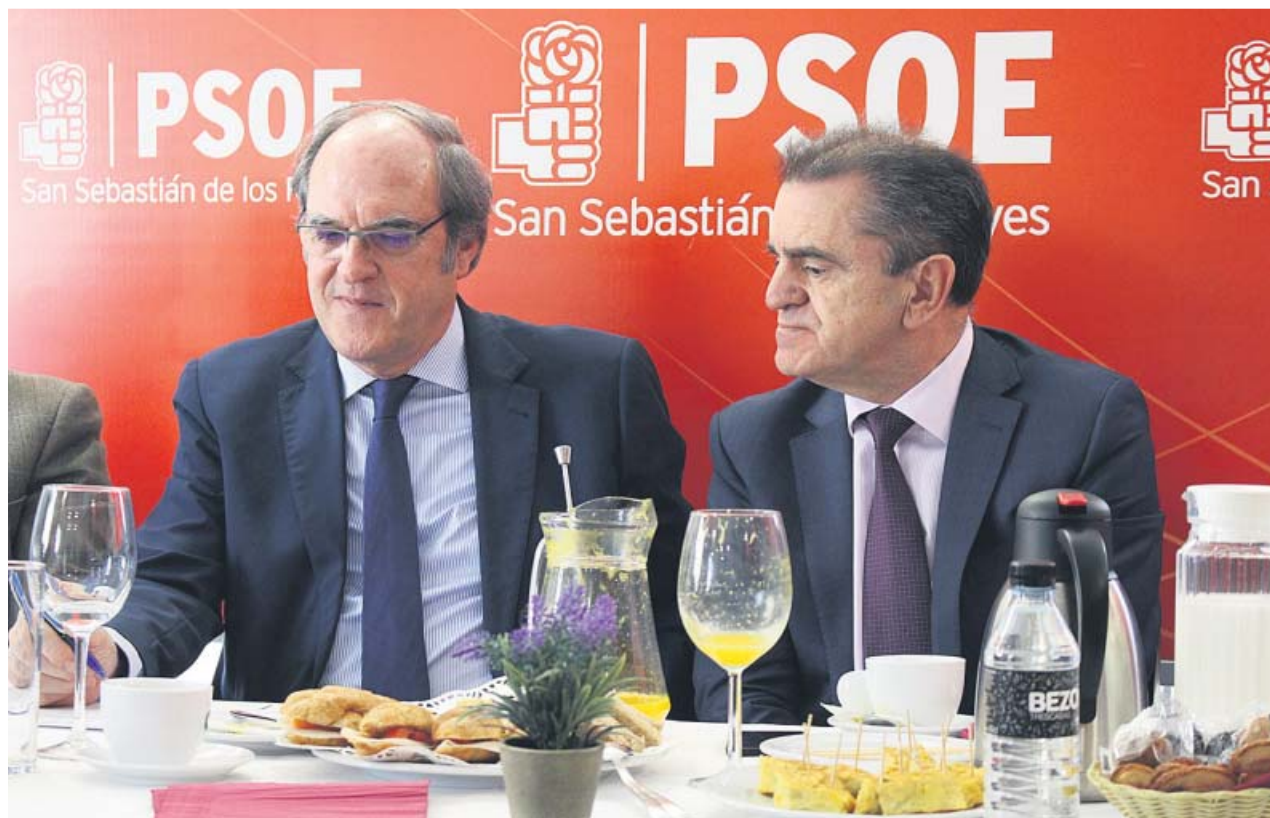
Ángel Gabilondo y José Manuel Franco, en un acto en San Sebastián de los Reyes, a finales de febrero de 2020.

El alcalde de Sevilla, Juan Espadas, y la secretaria general del PSOE-A, Susana Díaz, se enfrentarán en primarias para liderar la candidatura de los socialistas andaluces en las próximas elecciones autonómicas. Así lo confirmaron ayer ambos candidatos horas antes de que la dirección federal del PSOE decidiera adelantar el proceso